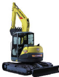
Photo de chantier