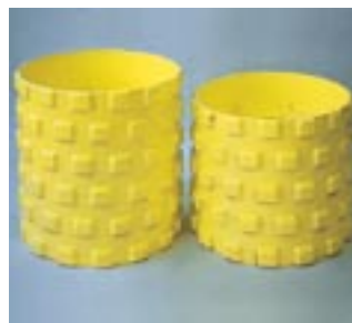
Diverses largeurs et profils de bandages