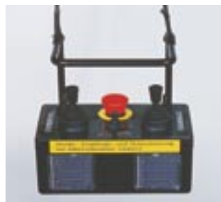
Télécommande infrarouge à cellules solaires