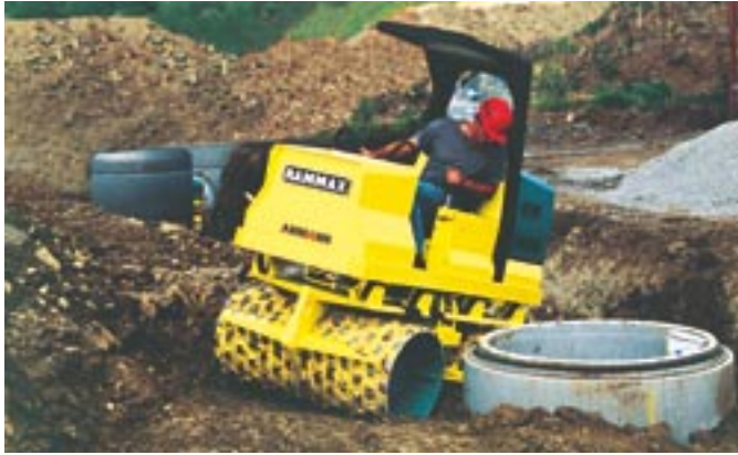
RW 2900: Le rouleau de tranchée le plus puissant du monde