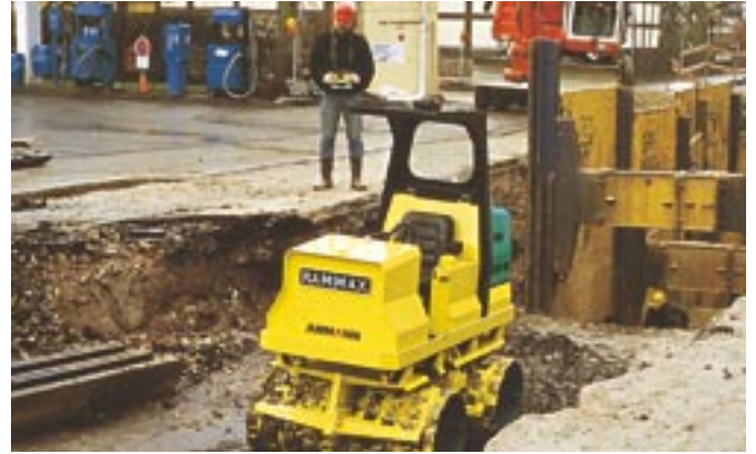
RW 2000: Compactage efficace sur de grandes surfaces